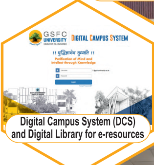
Digital Campus System (DCS) and Digital Library for e-resources