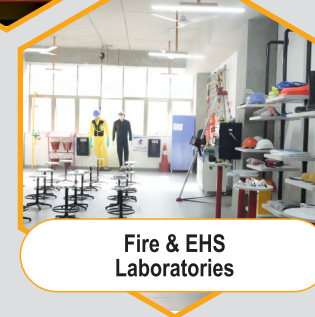
Fire & EHS Laboratories