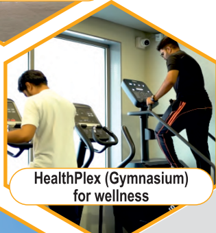
HealthPlex (Gymnasium) for wellness