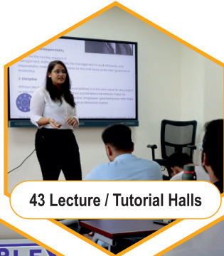
43 Lecture / Tutorial Halls