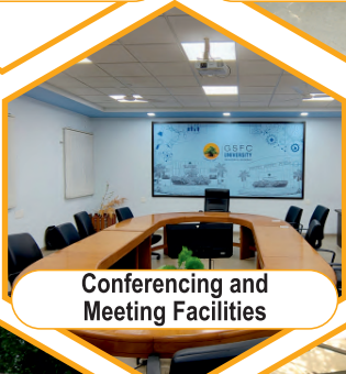
Conferencing and Meeting Facilities