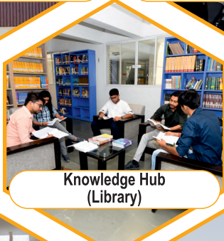
Knowledge Hub (Library)