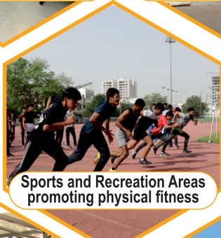
Sports and Recreation Areas promoting physical fitness