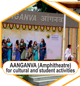
AANGANVA (Amphitheatre) for cultural and student activities