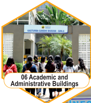
06 Academic and Administrative Buildings