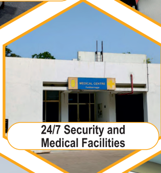
24/7 Security and Medical Facilities