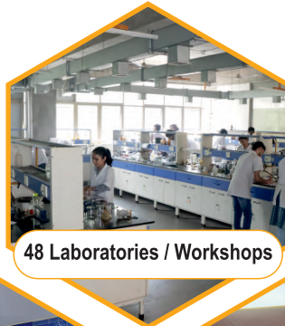
48 Laboratories / Workshops