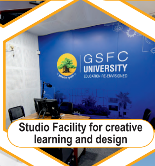
Studio Facility for creative learning and design