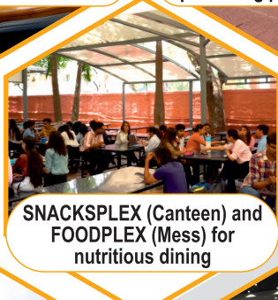
SNACKSPLEX (Canteen) and FOODPLEX (Mess) for nutritious dining