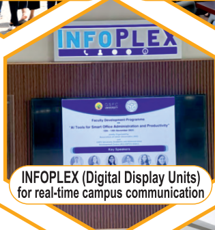
INFOPLEX (Digital Display Units) for real-time campus communication