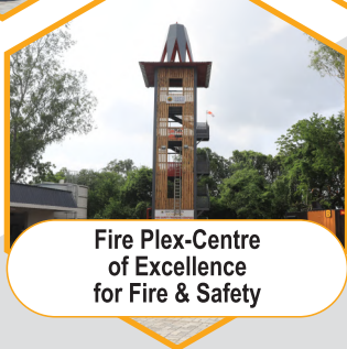
Fire Plex-Centre of Excellence for Fire & Safety